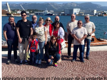
La délégation Italienne et l'équipage de la vedette Foch

Le dimanche 15 Mai 2022, nous avons sur demande de la Mairie de La Seyne, mis à disposition notre vedette Foch afin d'embarquer pour un transit entre le port de la Seyne et les Sablettes, une délégation Italienne et par la même occasion leur faire admirer et découvrir la rade de Toulon à bord de notre vaisseau Amiral.