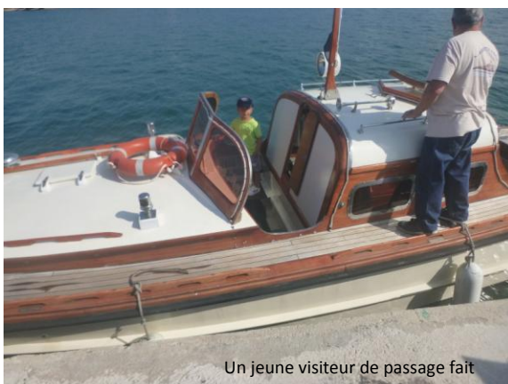
Un jeune visiteur de passage fait ses classes