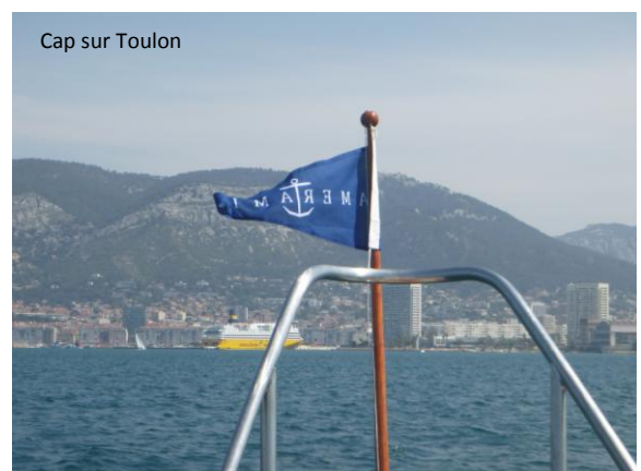
Cap sur Toulon